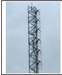
Parte del sistema radiante de Piraña FM